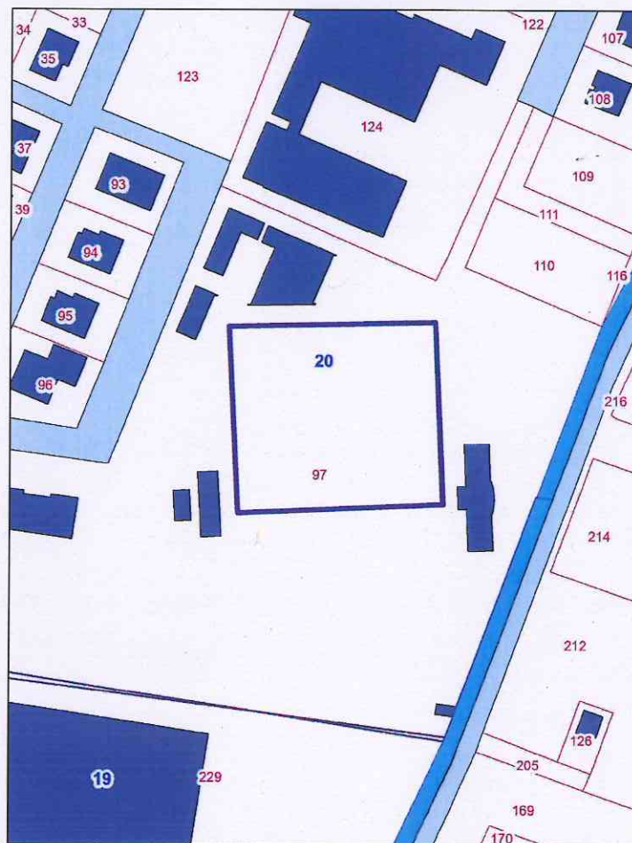
estratto catastale Fg 20 map.le 97 parte